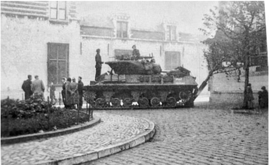
Een Canadese tank in de Steenbergsestraat hoek Beursplein BoZ

Tijdens de Tweede Wereldoorlog woonde ik met mijn ouders in Bergen-op-Zoom (provincie Noord-Brabant) in Nederland. Rondom onze stad, die niet ver van Antwerpen ligt, waren er tegen het einde van de oorlog hevige gevechten tussen de Duitse troepen en de bevrijdingslegers met troepen uit het Verenigd Koninkrijk en Canada (zie foto van de tank).