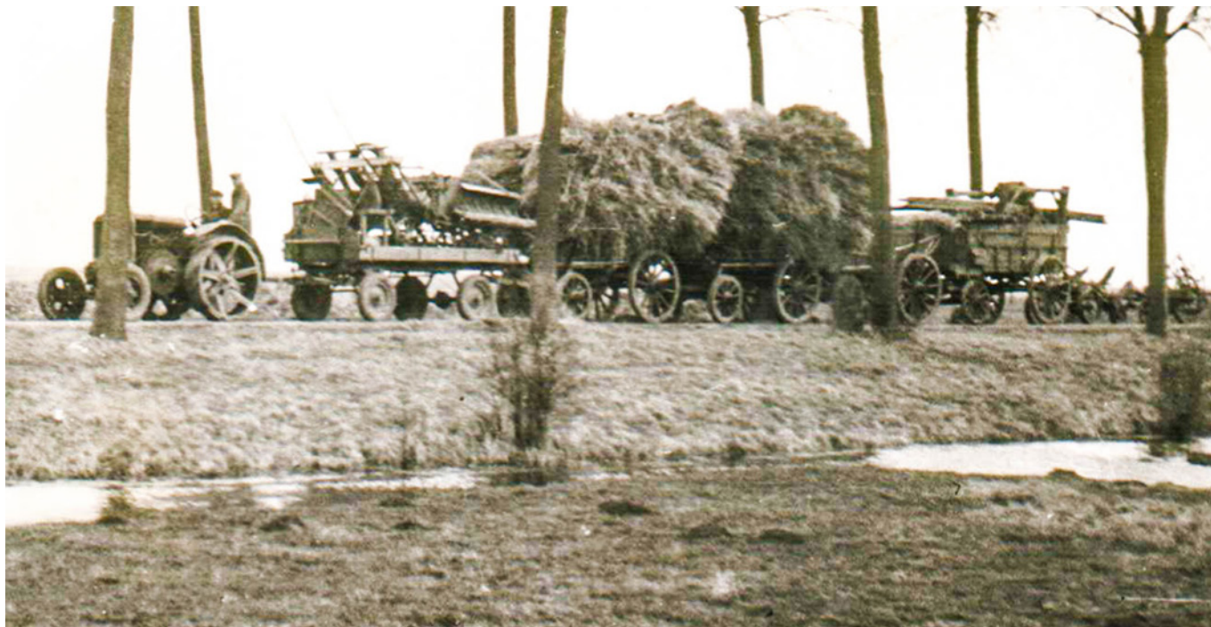
De evacuatie, op de vlucht voor het water.

vanaf mei 1945 het Bodemkundig Laboratorium van de Noordoostpolderwerken onder leiding van ir. Verhoeven begonnen met bodemonderzoek in Zeeland. Het laboratorium was speciaal hiervoor tijdelijk in Goes gevestigd. In 1946 werden 23.000 en in 1947 16.000 monsters grond onderzocht. Bij de eerste onderzoeken was het zoutgehalte van de destijds geïnundeerde gronden ongeveer 20 tot 25 gram per liter. Door de vele regen werd in 1948 bijna overal minder dan 1 gram per liter gemeten.