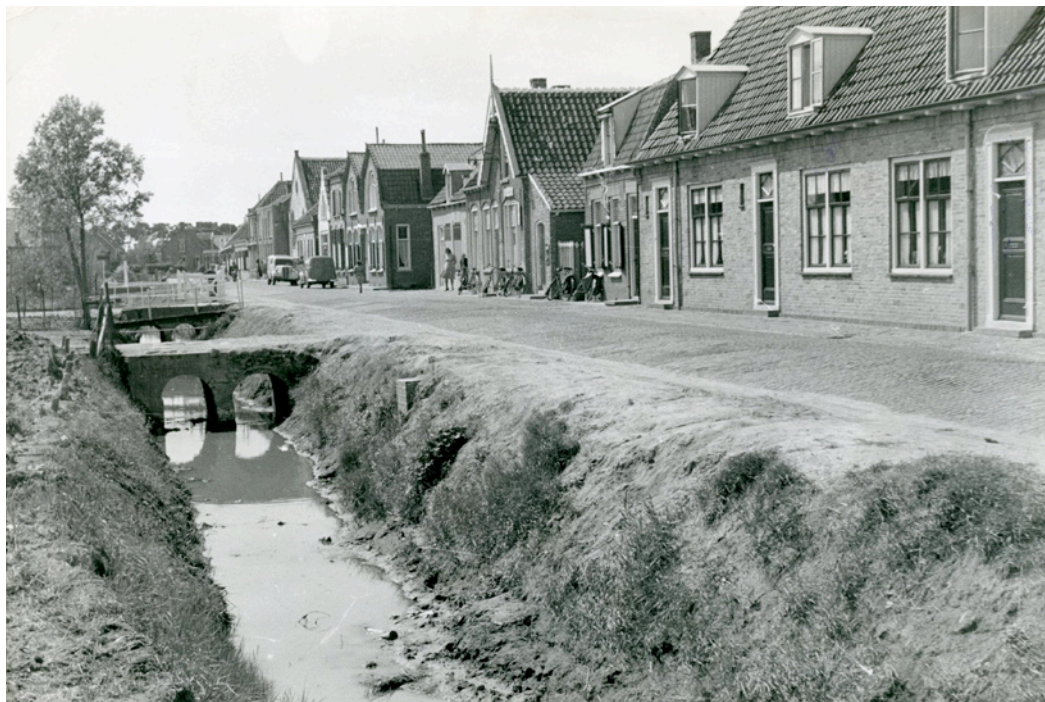
Stoofstraat in Poortvliet met rechts de nieuwbouwwoningen en in het midden het postkantoor.