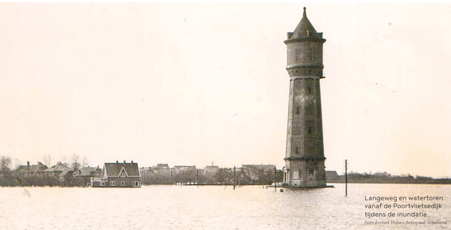
Langeweg en watertoren vanaf de Poortvlietsedijk tijdens de inundatie.