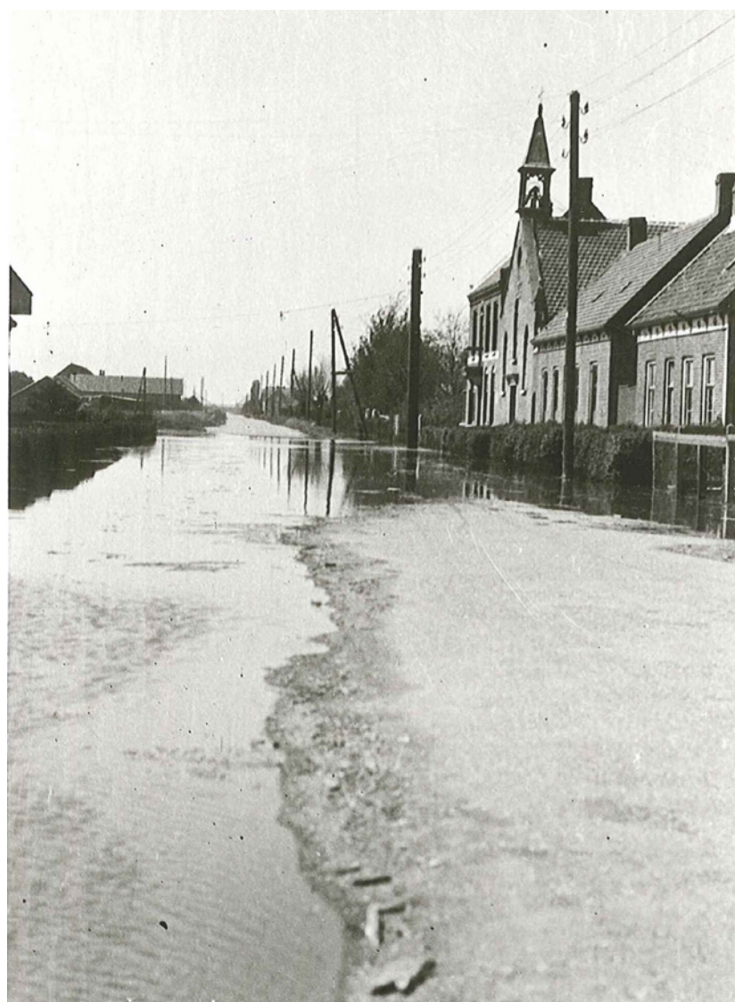
Inundatie tijdens Pinksteren 1944 met zicht op de Gereformeerde kerk van Anna Jacobapolder.