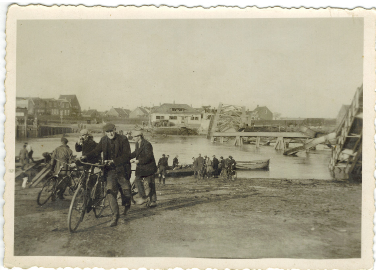
De verwoeste brug bij Tholen.

Aldus beschrijft mevrouw van Oost-Gelderblom haar ervaringen.