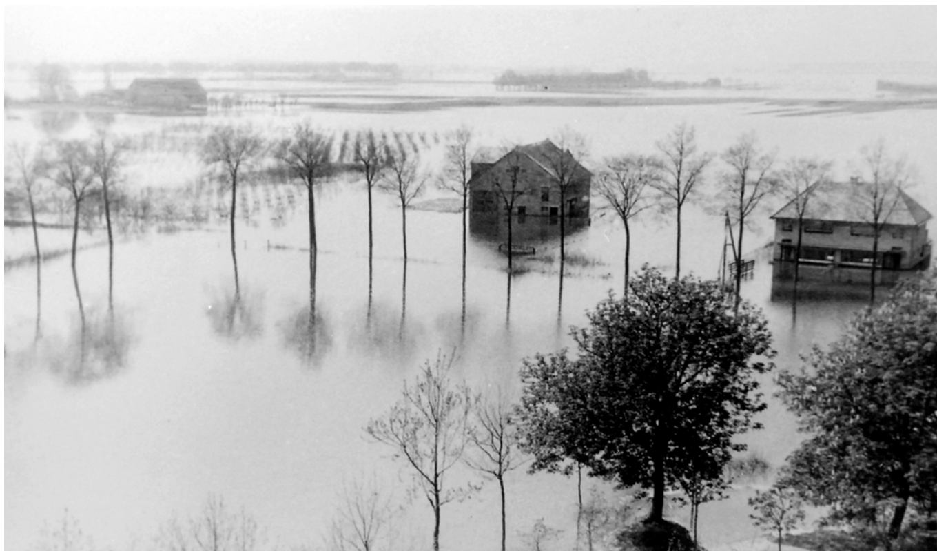
Ten Ankerweg vanaf de molen tijdens de inundatie te Tholen.