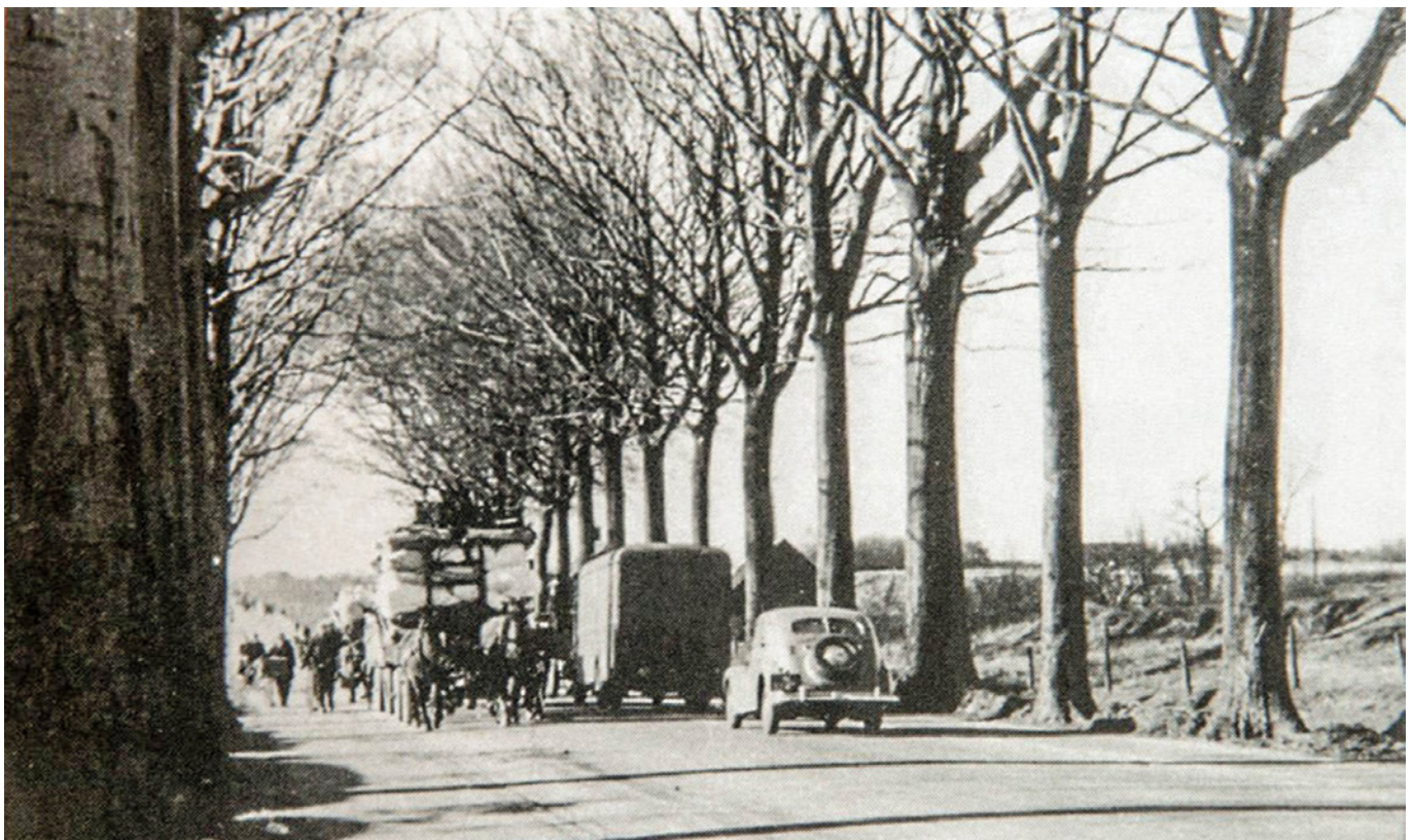
Tholen onder water gezet, de evacuatie.

Pas in de Bredasche Courant van 11 maart 1948 lezen we dat er in Tholen praktisch geen zout meer in de grond zit en de deskundigen van mening zijn dat in 1950 of 1951 de grond van alle Zeeuwse gebieden die geïnundeerd zijn geweest, weer normaal zal zijn. Om dat te bereiken is