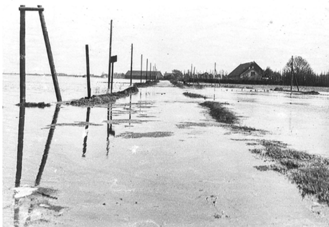
Inundatie tijdens Pinksteren met zicht op de Langeweg met huizen en schuren Anna Jacobapolder.

De inwoners van Bergen op Zoom en Halsteren werden door de Duitsers verplicht om evacués op te nemen in hun huis. Uitgezonderd waren die mensen of gezinnen waar dat vanwege medische gronden niet mogelijk was. Wij komen dit tegen in brieven van 15 maart en 5 april 1944. Deze gezinnen staan met naam en adres vermeld. Er staat letterlijk: 'Deze gezinnen komen niet in aanmerking om