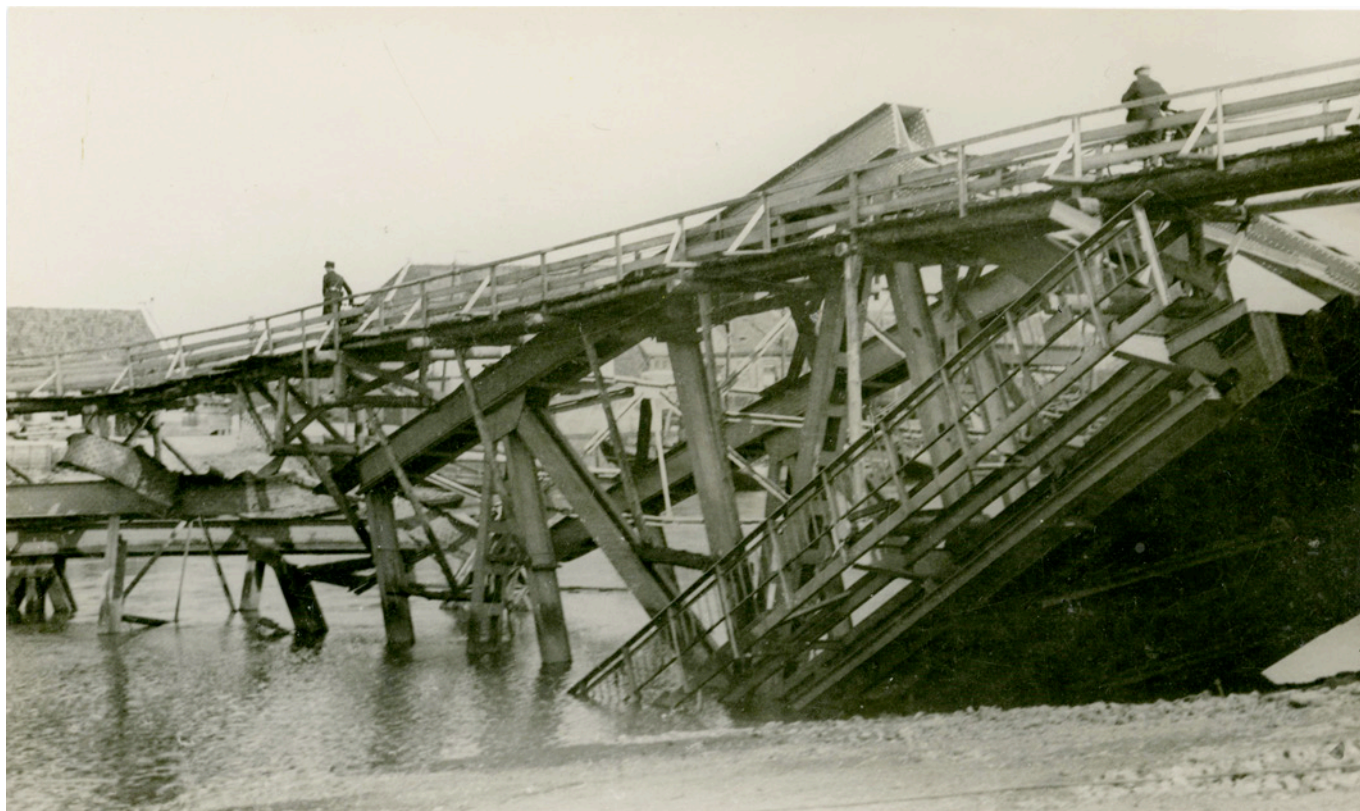
Opgeblazen brug over de Eendracht met houten noodbrug te Tholen.

'Blijkens door ons ontvangen mededeeling komt het voor dat personen, welke hetzij met vergunning, hetzij zonder, tijdelijk hun woningen weder op het eiland Tholen betrekken, bij u