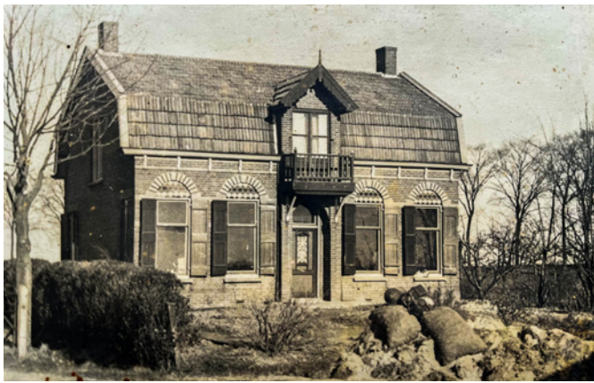
Boerderij Hoeve Mon Desir aan de Postweg van Poortvliet naar Tholen.